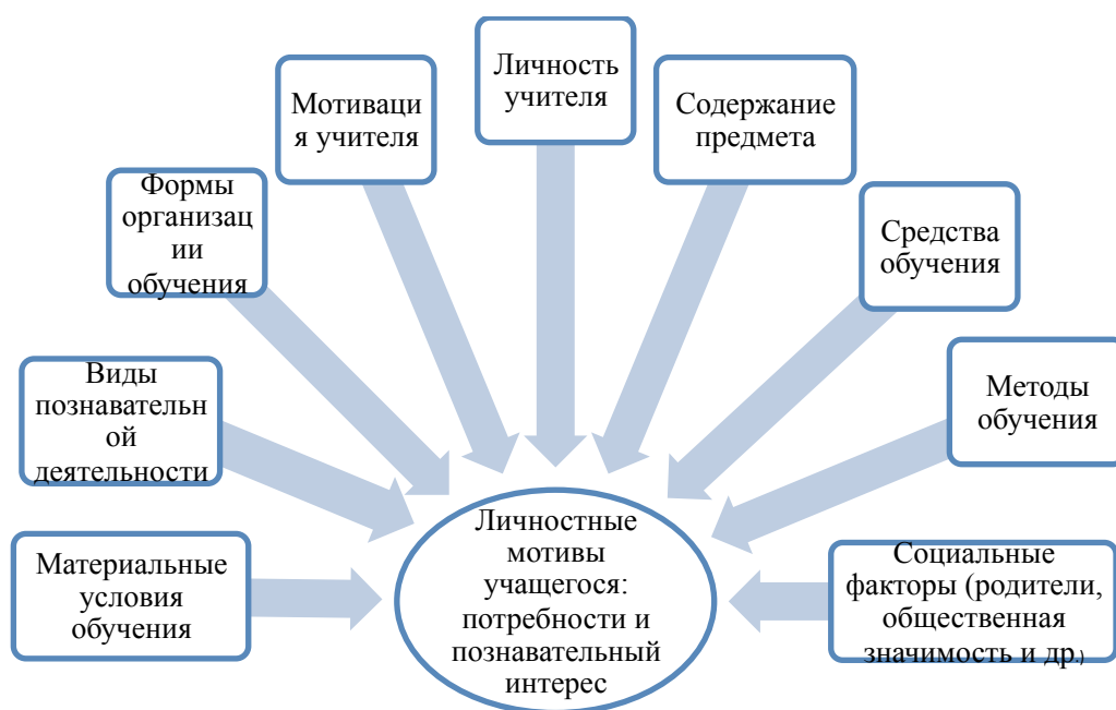
Рис. 1, Факторы, влияющие на личностные мотивы учащихся

Направленный на формирование и развитие компетенций, предметный стандарт учитывает все сферы развития личности учащихся: познавательную, эмоциональную и психомоторную, которые последовательно отражают преемственность и прогресс школьников при переходе от одной ступени образования к другой. В этом контексте в образовательном процессе следует использовать разнообразные стратегии обучения, соответствующие возрасту учащихся, с целью поддержки и стимулирования мотивации изучения предметов, формирования личностных качеств, развития индивидуальных достижений.