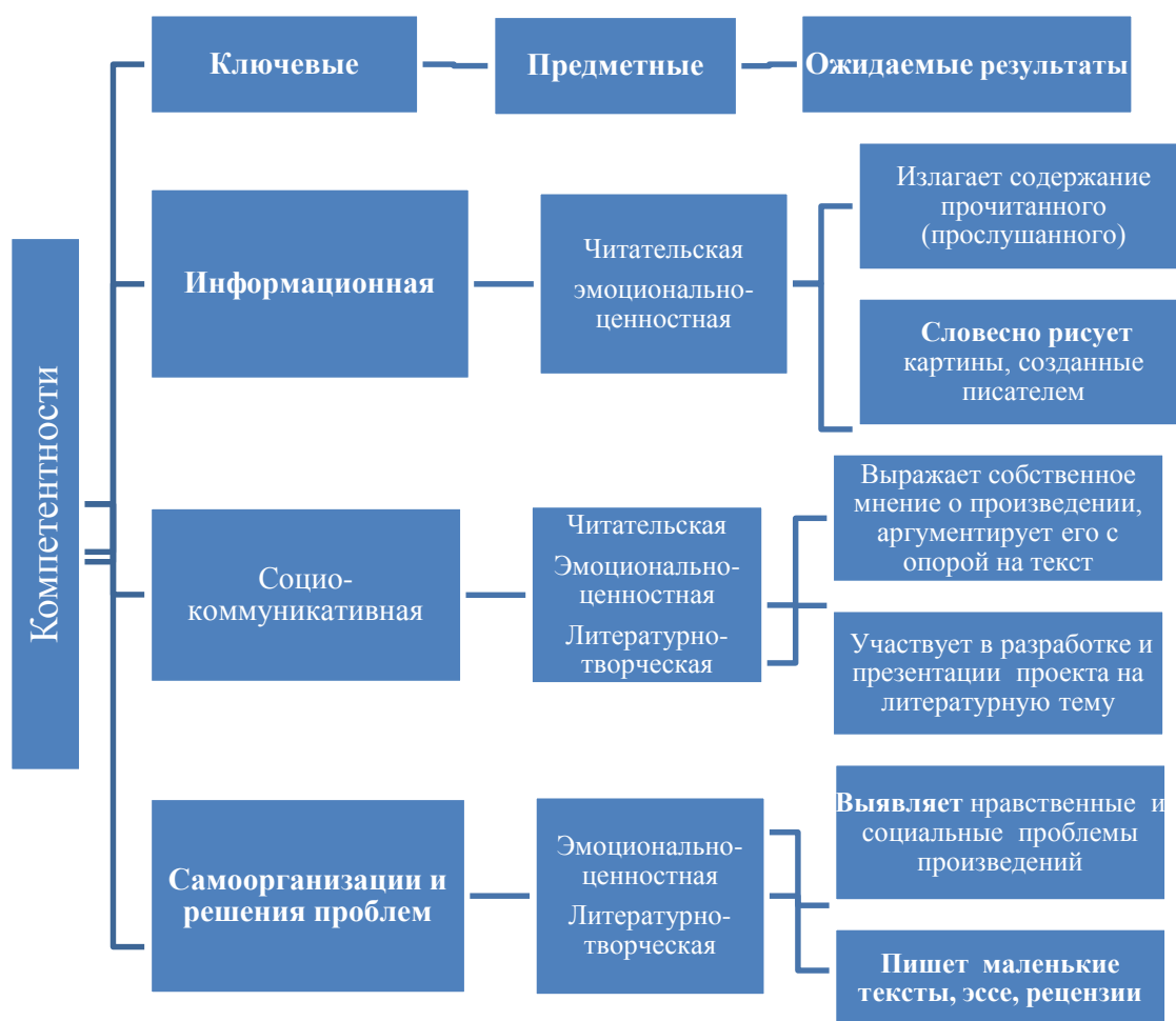
Схема 1. Проявление ключевых компетентностей в предметных